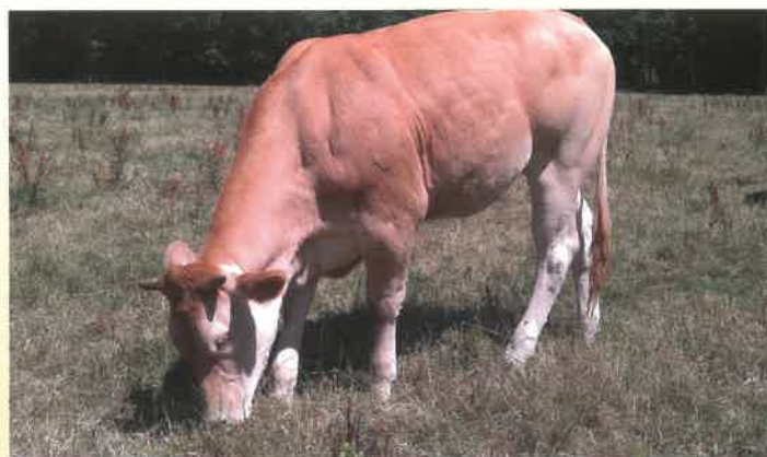
Élevage H. Kip De Wijk (Pays-Bas)