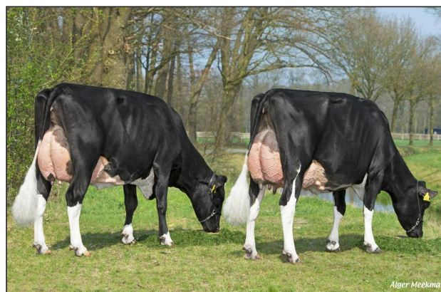
Filles de MALKI : BIG SUPERSTAR TB 89 BIB RINNIE TB 86