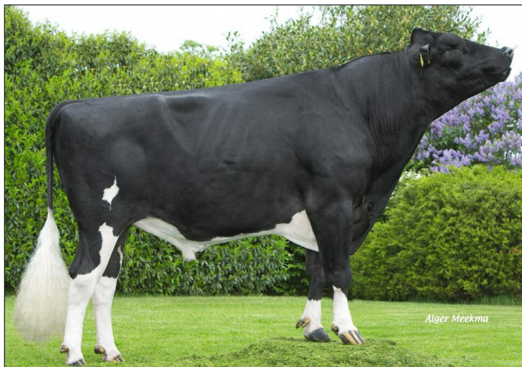
MALKI NL 00074046 6834 - né le 27/03/2012 - N° d'agrément 91272