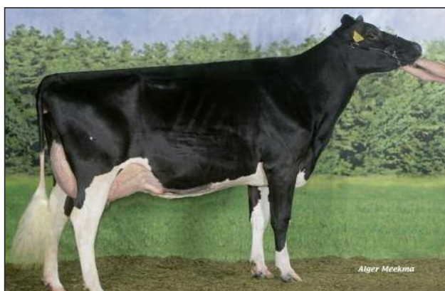
Mère de MALKI : BIG ANNA JACOBA 115 (EX 90)

MALKI est conseillé sur la plupart des vaches laitières excepté sur les filles de Basman et Sentaro.