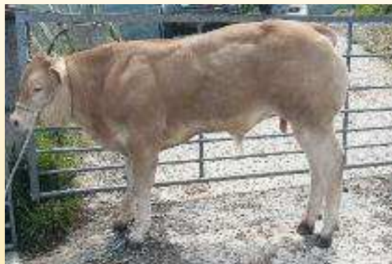
Élevage Xabi Etchemendy Maison Bastilia - 64220 Arneguy