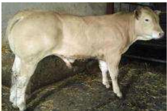
Élevage Gaec Kixkaxilo Maison Larraldia - 64120 Saint Just Ibarre

Les veaux de FERMIN naissent facilement. Ils présentent une ossature fine avec une morphologie viande très marquée. Idéal pour la production de veaux "sous la mère", FERMIN génère des veaux précoces à viande blanche.