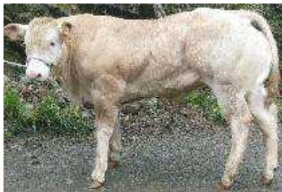
Élevage Didier Arosteguy Maison Urineizia - 64220 Esterencuby