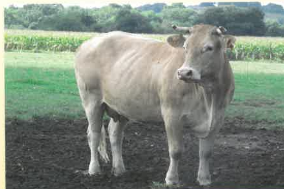
Élevage Jean-Pierre Lasmarigues Route d'Azacq - 40320 Lacajunte