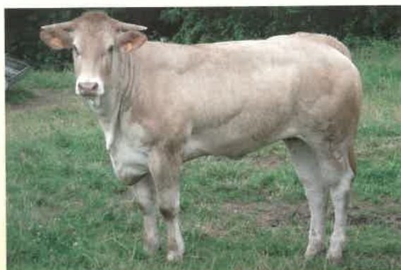
Élevage Christian Etchebes Maison Iduski Eder - 64120 Arraute

Ses veaux à tendance blond foncé naissent normalement. On retrouve sur la descendance de CACAO-2, ses propres qualités génétiques : longueur, taille, arrondi de culotte et un bassin large avec des trochanters éclatés donnant à ses filles des aptitudes optimales au vêlage.