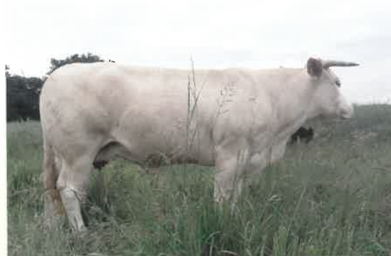
Élevage Patrick CAZALA Maison Lascoumes - 64390 Orriule