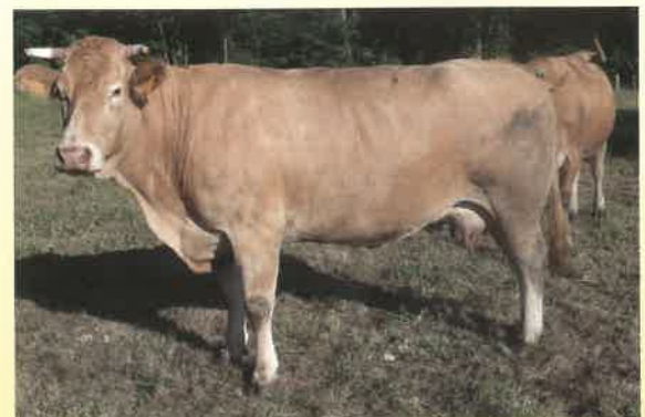
Élevage Xavier Inçagaray Maison Marchantenia - 64640 LANTABAT