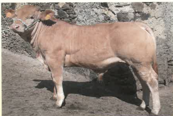
Élevage Patrick Camou Maison Moussiou - 64220 Arneguy

Grâce à une origine nouvelle, BOURBON est facile d'utilisation. Sa bonne aptitude au vêlage lui permet d'être utilisé sur génisses. Fins à la naissance, les veaux expriment un GMQ élevé et s'éclatent rapidement.