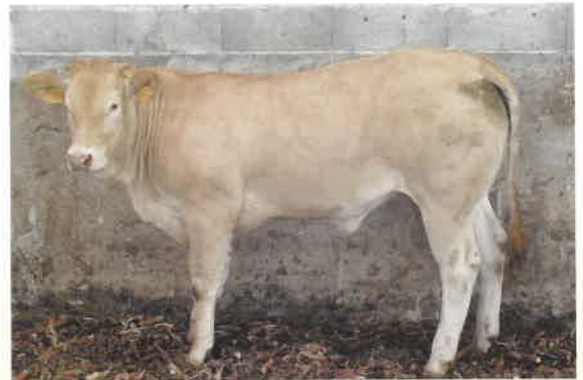
Élevage Gaec Joinillon - Maison Joinillon Eliceiry - 64240 La Bastide Clairence